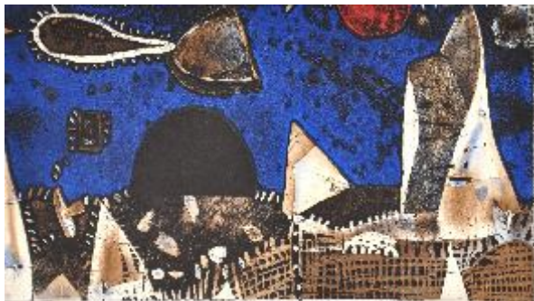
GÓRA I DZIURA